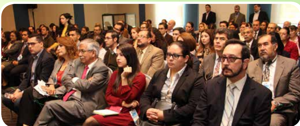
Cerca de 300 médicos asistentes