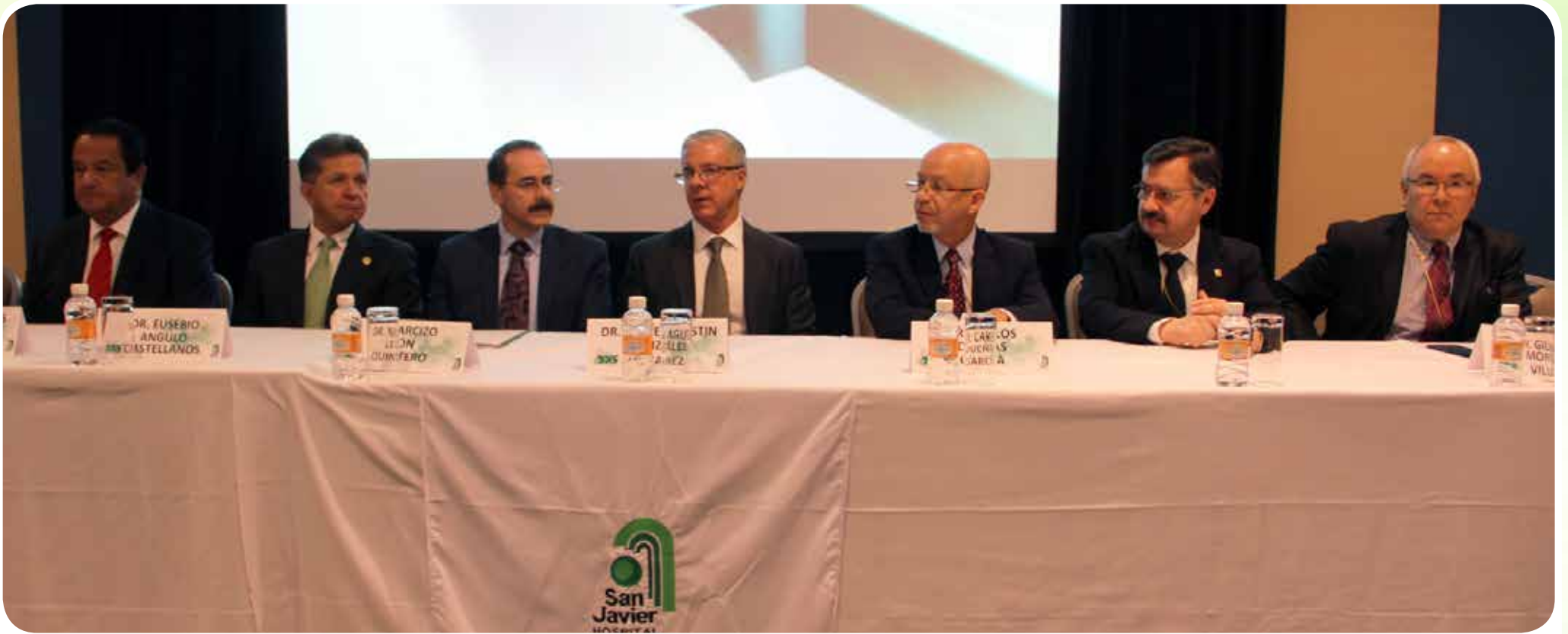
Ceremonia inaugural de las Jornadas Médicas de Aniversario 2015 Hospital San Javier

Con motivo de preservar la salud y en la búsqueda de altos estándares de calidad, Hospital San Javier, organizó los días cuatro y cinco de diciembre en el Hotel NH sus Jornadas Médicas de Aniversario "Oncología al Límite II", dentro del marco conmemorativo a su vigésimo primer aniversario, que tuvo como objetivo reunir reconocidos especialistas nacionales e internacionales para analizar los más recientes avances en materia de oncología.