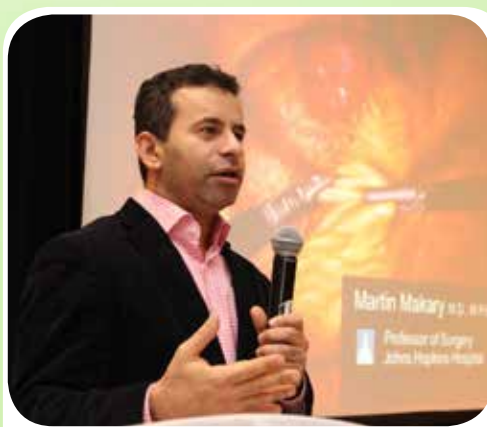
Martin Makary M.D. Hospital Johns Hopkins Baltimore